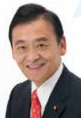
参議院議員 末松 信介

険しい道のりでしょうが、必ず皆様の期待に応えてくれるものと確信します。誠実で郷土愛あふれる吉岡君に力をお貸しください。